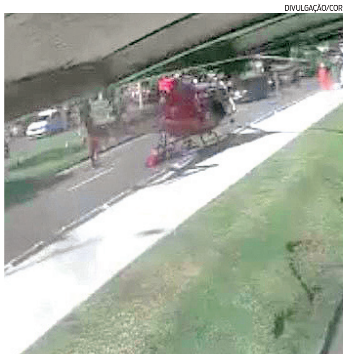
Objetivo foi resgatar vítimas de acidente entre dois carros e moto