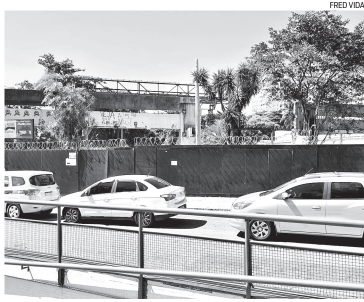
Apenas algumas estruturas metálicas sobraram do antigo Canecão

Em 2023, a Universidade Federal do Rio de Janeiro (UFRJ), dona do espaço, promoveu um leilão para selecionar uma nova concessão. O vencedor foi Bônus Klefer, constituído pelas empresas Bônus Track e Klefer Produções, que desembolsou R$ 4,35 milhões e ficará responsável pelo terreno por um período de 30 anos. Com todas as licenças aprovadas para a demolição, o consórcio informou que essa etapa está “quase 100% concluída” e as obras para a construção do novo imóvel começarão logo