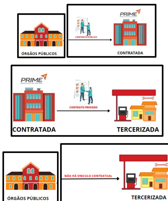
Imagem 02: Demonstração do Serviço de Quarteirização

Conforme mencionado o atual modelo utilizado pela Administração é o de quarteirização, existindo duas relações contratuais, a primeira entre a Contratada e o Órgão Público por meio do contrato administrativo, e a segunda entre a Contratada e a sua Rede Credenciada mediante o contrato privado, se dividindo da seguinte maneira: