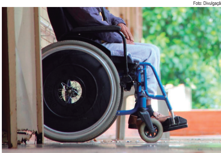
Objetivo da certificação é incentivar as empresas, bares, restaurantes e supermercados a promoverem a acessibilidade em seus estabelecimentos

Caso sejam aprovadas, as empresas poderão utilizar o Selo de Acessibilidade em seus estabelecimentos e materiais publicitários, e a Prefeitura irá manter em seus sites a relação de empresas detentoras do selo, de modo a permitir às Pessoas com Deficiência a verificação dos estabelecimentos regularmente adaptados. Para manter o Selo, as empresas terão que manter as condições de acessibilidade existentes no momento