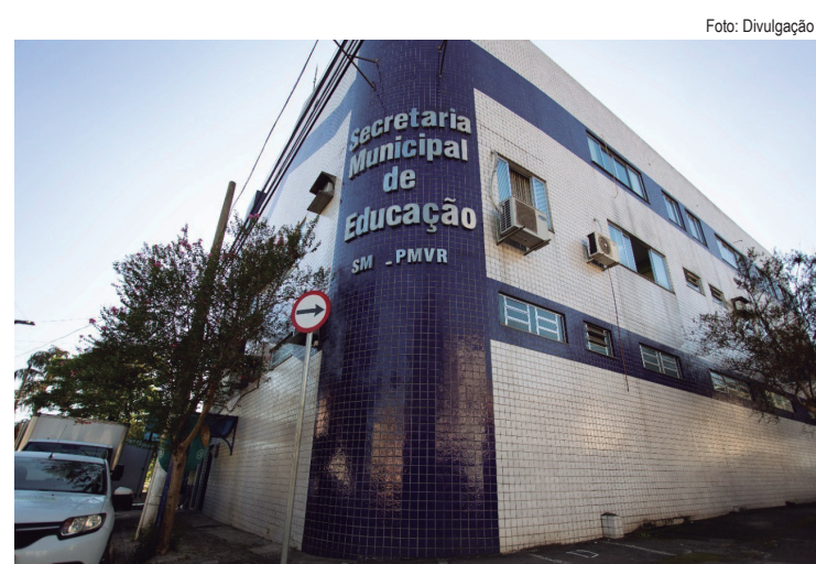
Serão oferecidas 100 vagas para área educacional e interessados poderão se inscrever a partir de terça-feira (14) até o dia 20

Caso o candidato tenha dificuldades com o acesso à internet, a inscrição poderá ser feita na Subprefeitura do Retiro (Avenida Antônio de Almeida, 46). O valor da inscrição é de R$ 30, que pode ser paga até 21 de maio, mas os interessados podem solicitar a isenção da taxa de inscrição, dentro dos seguintes requisitos: estar inscrito no CadÚnico (Cadastro Único para Programas Sociais do Governo Federal) e for membro de família de baixa renda; se for doador regular de sangue; ou se estiver cadastrado no Registro