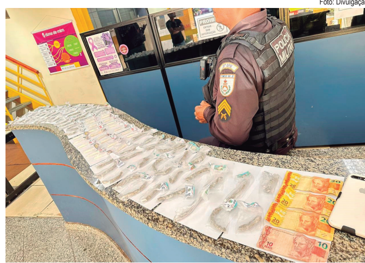
Material apreendido estava escondido numa sacola

O suspeito e os materiais apreendidos foram encaminhados à 88ª Delegacia de Polícia para as medidas cabíveis.