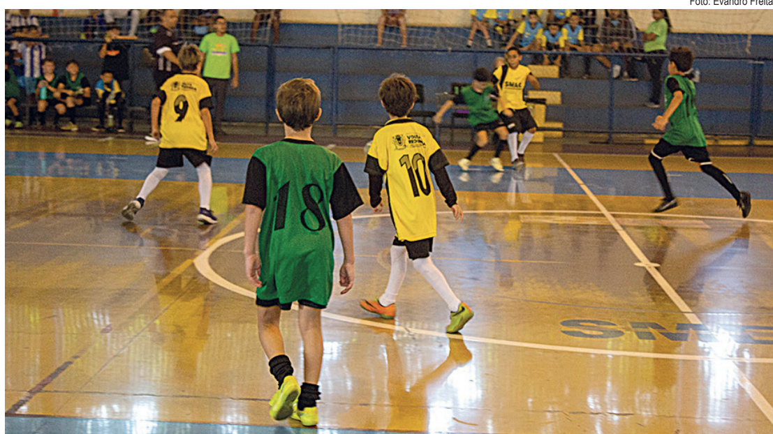
Jogando no Retiro, SMAS Volta Grande bateu a equipe do Arena Aterrado

Em cada chave, os times se enfrentaram entre si. Os jogos foram bastante disputados e os jogadores foram embalados pelos gritos de incentivo vindos das arquibancadas. Disposta a passar de fase, a garotada não poupou esforços para sair de quadra com a vitória.