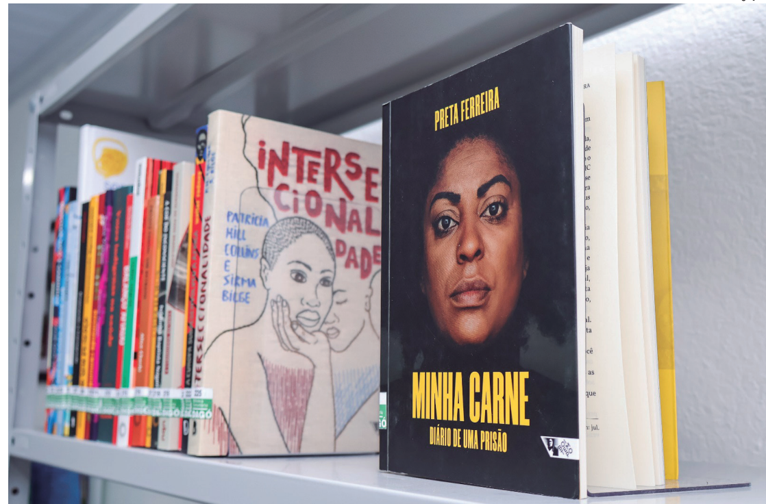
Biblioteca Comunitária Dagó é focada em autores negros e indígenas que tratam de diversos assuntos, de romance a poesias

O Clube Palmares foi fundado em janeiro de 1965 e é uma associação civil filantrópica, sem fins econômicos, com autonomia administrativa e financeira destinada à comunidade afrodes-