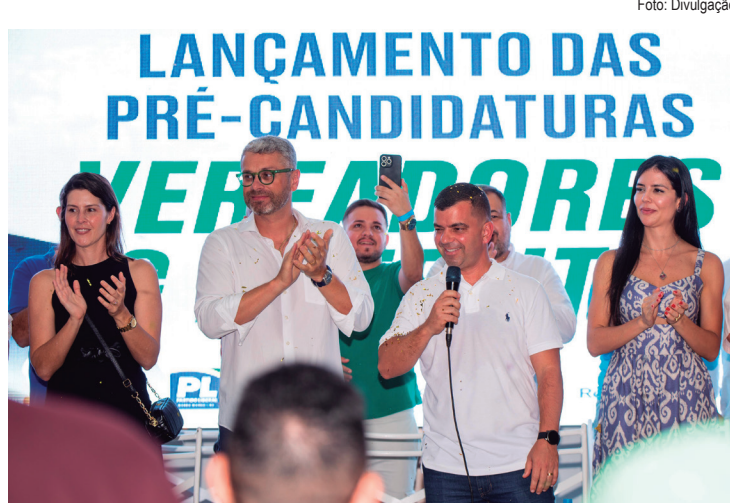
Durante evento também foram lançadas as pré-candidaturas a vereador e vereadora dos sete partidos