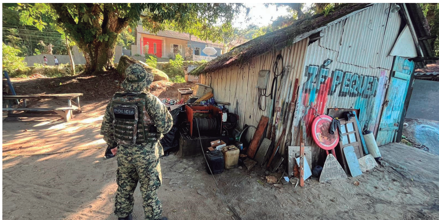
Ocorrência foi registrada na 166ª Delegacia de Polícia