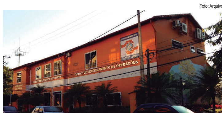
Campanha terá início na segunda-feira (13), com pontos de arrecadação nos CRAS e na sede da Defesa Civil

– Ressaltamos a importância da participação de toda a população nessa ação de solidariedade. Qualquer contribuição será de grande ajuda para os afetados pelas enchentes em todo o Estado do Rio Grande do Sul – comentou o secretário de Defesa Civil, Fábio Júnior Pires.