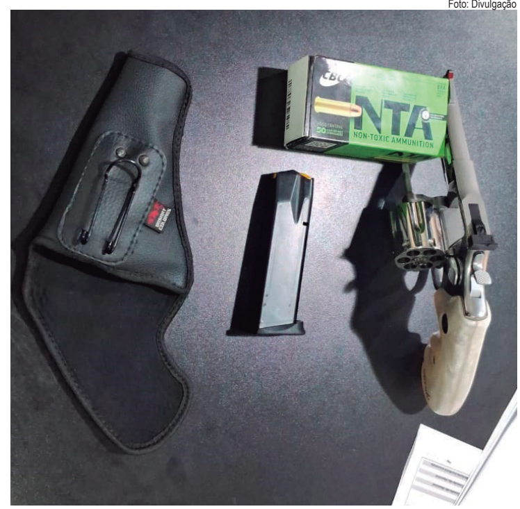
Após depoimento na delegacia, suspeitos foram liberados

O homem, de 32 anos, foi detido e todo o material apreendido foi encaminhado para 93ª DP. Os suspeitos foram liberados após as diligências policiais.