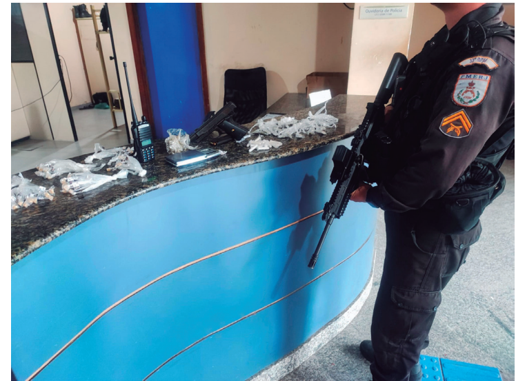
Suspeito estava com uma pistola na cintura e drogas em uma sacola