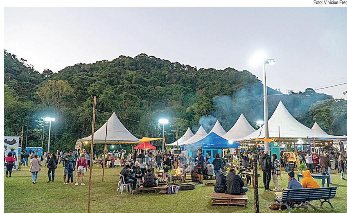
Como na edição anterior, o festival acontece no Campo de Futebol do Lote 10

Para esta edição, já estão confirmadas as Cervejarias Visconde de Mauá e Rio Preto, de Visconde de Mauá; as Cervejarias Hays e Paranoide, de Volta Redonda; as Cervejarias Ograner e Beer Rock, de Resende; a Cerveja Rio Preto, de Rio Preto-MG; a Cervejaria Ferdinand, do Rio de Janeiro; a Cervejaria Trevisan, de Penedo e ainda a Cervejaria Elbers Bier, da Serrinha do Alambari.