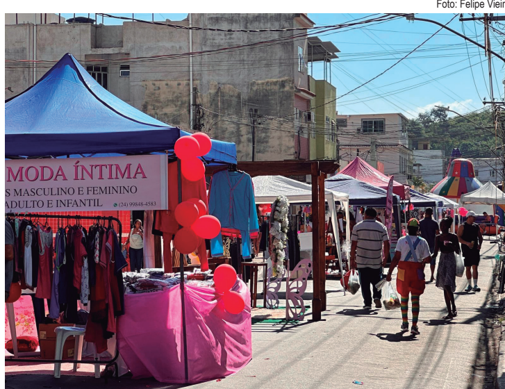
Edição especial de Dia das Mães contou com lojas abertas até as 16h e outras atividades oferecidas a todos