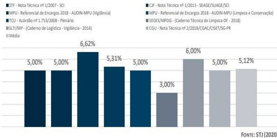
GRÁFICO 1 - PERCENTUAIS DE CUSTOS INDIRETOS ADOTADOS EM ÓRGÃOS PÚBLICOS BRASILEIROS

Considerando o histórico de contratações do STJ, o presente modelo considera razoável o percentual máximo de 3,00% (três por cento) para alíquota de custos indiretos. O citado percentual é compatível com diversos estudos técnicos empreendidos por órgãos públicos de referência: