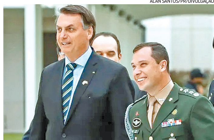
Cid é investigado por tentar vender joias sem autorização da União