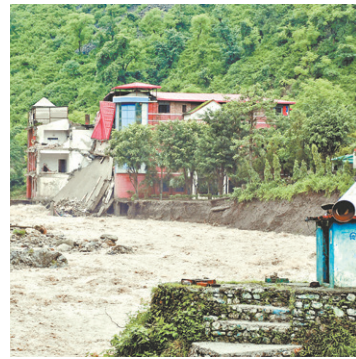
Monção causa destruição e mortes