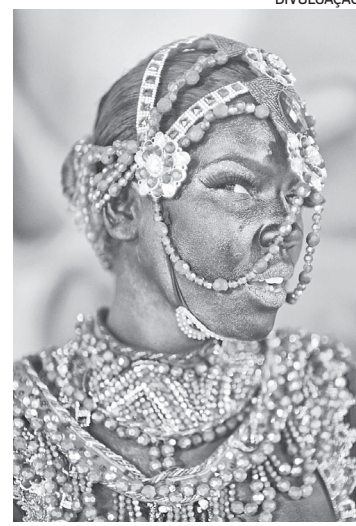
Carnaval é o tema da mostra