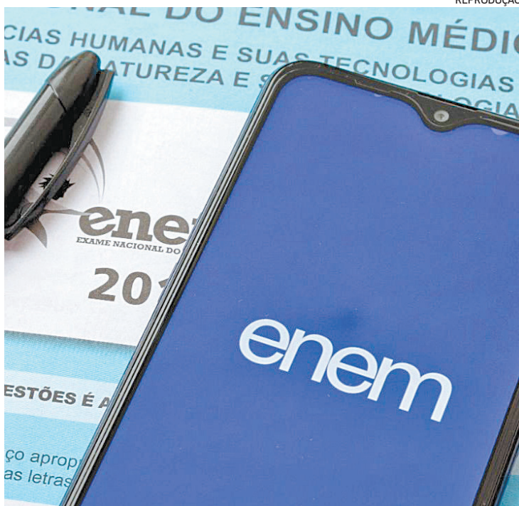
Reprodução. Primeiro dia de prova trouxe questões de linguagens, ciências e redação

Todas as dicas de autocuidado, de revisão, de alimentação e de descanso valem também para o segundo dia de exame. Mesmo quem não se saiu muito bem no primeiro dia de provas, pode ter a chance de recuperar agora o desempenho. “Não adianta ficar nos conteúdos mais di-